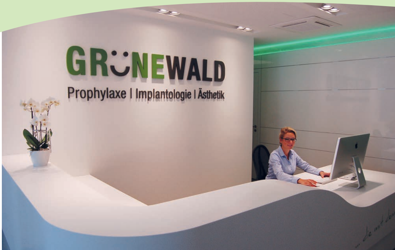
Modern, großzügig und freundlich – der neue Empfang in der Zahnarztpraxis Dres. Grünewald in Koblenz