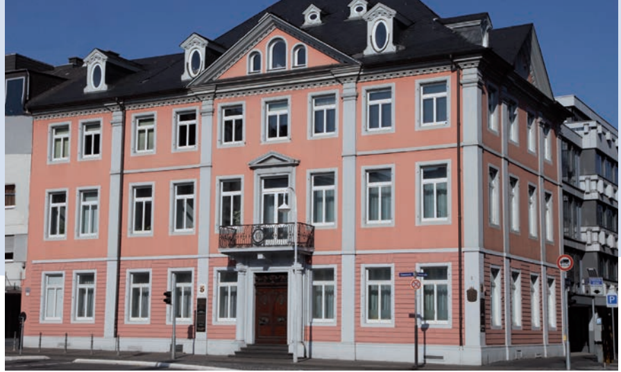
Die Praxis am Deinhardplatz bietet Zahnheilkunde auf höchstem Niveau – und unterstützt dies mit HighTech-Komfort