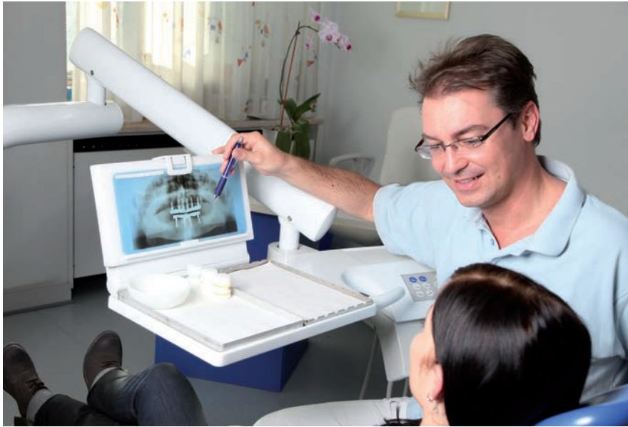
Der Patient im Mittelpunkt: Professionelle zahnmedizinische Rundum-Versorgung aus einer Hand und viel menschliches Einfühlungsvermögen