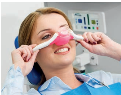
Schonende Lachgassedierung nimmt die Behandlungsangst