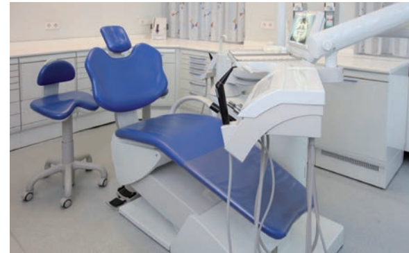
Implantate können ein Leben lang halten – die Voraussetzungen und die Nachsorge müssen allerdings stimmen